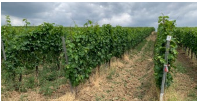
Mit Green on® Vital behandelt