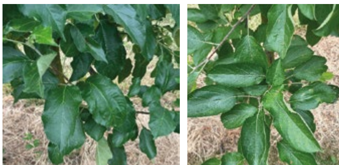
Behandlung mit Green on® Start