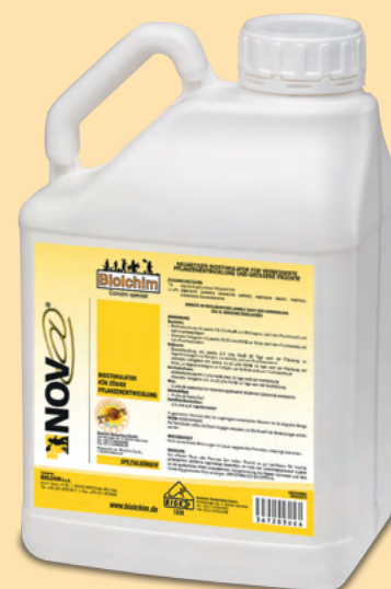
Gebindegrößen: 5, 20, 200, 1.000 l